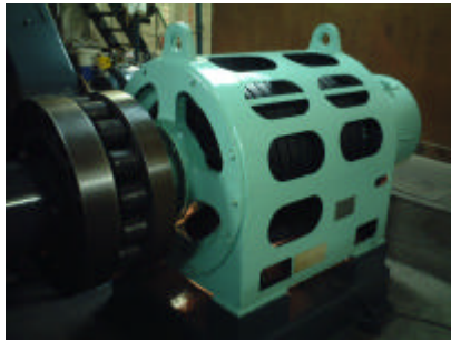
3.3KV 150KW 三相誘導電動機

1本の長いワイヤーロープの両端に車両がぶらさがり、山上の電気モーターでつるべ式に車両を上下させるようになっています。車両重量は10.2トンありますが、傾斜とつるべ式のためにそれほど大きな力は要りません。モーターは三相交流3.3KV、出力150KW(約204馬力)で、常用と予備の2台があります。