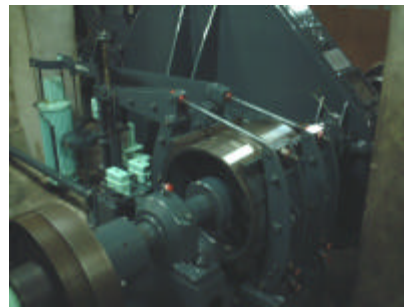
手動と自動2系統の制動装置 (ドラム式ブレーキ)