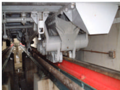
車両側の制動装置 万が一、ロープに異常が発生した場合等に、レールを挟んで車両を止めます。