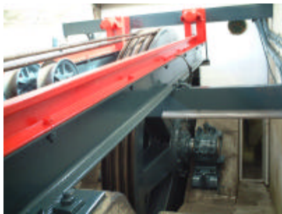
従索輪、直径3.4m 主索輪との間でロープを8の字に掛け滑らないようにしています。