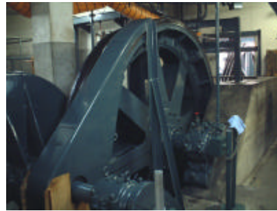
主索輪、直径は3.4mあります。 ロープ太さは32mm