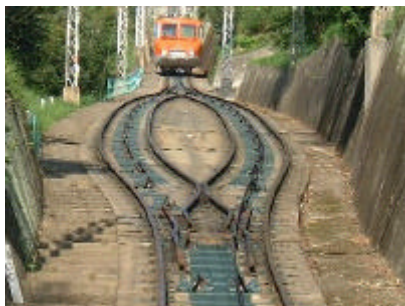
離合所にポイント切り替えはありません。