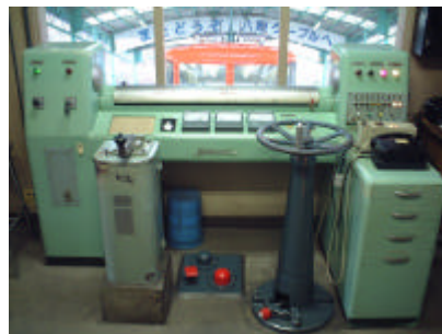
運転台 左側のレバーがノッチ(速度制御) 右側のハンドルがブレーキ